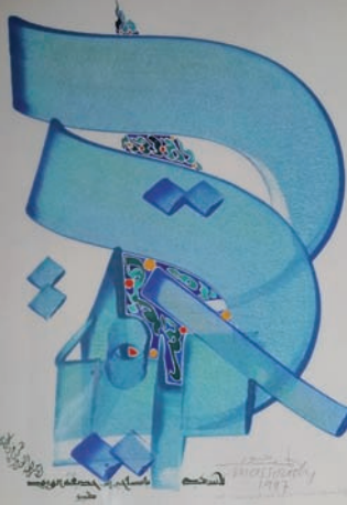
© Hassan Massoudy - Photographie d'une calligraphie inspirée par ce vers du poète Kabir

Jeudi 9 mars Cafétéria MCL « Ma bohème » de 17 h à 18 h et de 19 h à 20 h