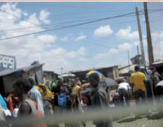
Visuel : Marché de Harar

« Rimbaud vu de Harar » par Alain Tourneux, Président des Amis de Rimbaud / Association internationale, Conservateur honoraire du musée Arthur Rimbaud en partenariat avec l'association Charleville / Harar.